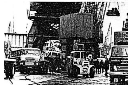
«Båtar från våra varv skulle kunna frakta sad till områden med standiga behov»