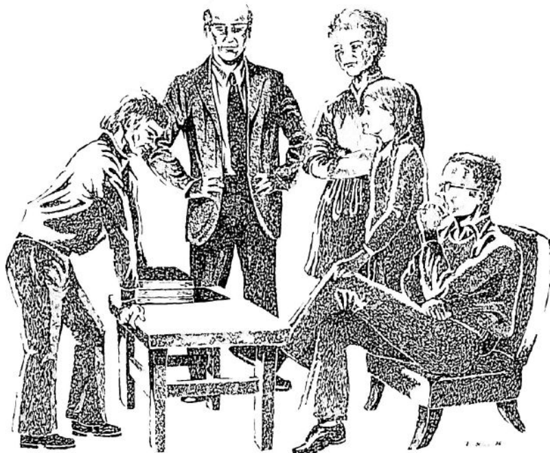
Tecknat för NVIB av Karl Olov Steen

manhang Men ingen har kunnat i stallet foreslå t ex relativ, relativ arlighet osv går ju inte alls, i varje fall inte som en norm eller en appell Alltså borde alla kristna bekannare kunna samlas om en ideologi utformad i den gyllene regeln och i de fyra absoluterna