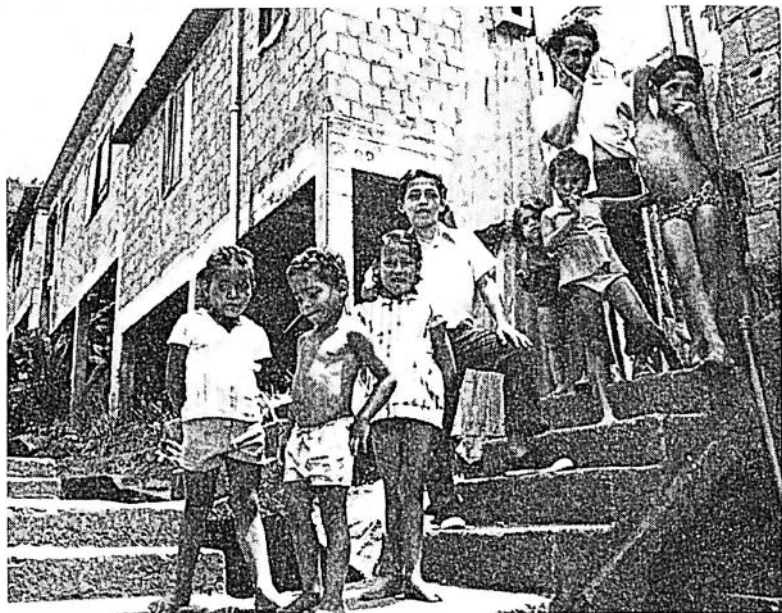
Dessa barn hör till dem som fått flytta in i de nya hus som håller på att ersätta gamla ruckel.

Det var vid den tiden som vi blev hotade med vrakning av agaren till den höjd där favelan efterhand hade vuxit upp. Vi hade alla kommit norrifrån eller från det inre av landet, för vi var sakra på att vi skulle finna arbete och ett dragligt ställe att bo på i Rio. Men hyrorna var för höga. Och till slut hade vi byggt vara ruckel på de obebbyggda områdena. Vi måste ju bo nanstans för att ge barnen tak över huvudet. Det fanns en lag som förbjöd att man utkrävde hyra av favela-borna. Men den brydde sig inte agaren av vårt område om. Han hade gett order om att alla som inte betalade honom vad de var skyldiga skulle ge sig av. Flera familjer hade blivit radda och betalat i hemlighet. Andra ville sätta stopp för utpressningen och tog kontakt med en advokat som skulle försvara vara intressen. Advokaten begärde tre cruzeros per familj och sade att om vi byggde nya baracker skulle agaren inte kunna vraka oss igen. Det var bara ett sätt för honom att tjäna mer pengar.