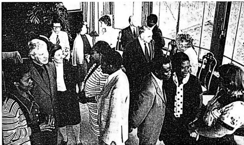
Rhodesiska delegater i Caux