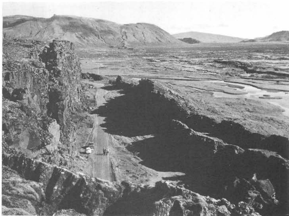
C'est ici qu'en l'an 930 s'est réuni le premier parlement islandais d'Althing dont on dit qu'il est le « grand-père » de tous les parlements.

Danemark quelques mois auparavant, elle venait de se rendre en Suède et en Norvège.