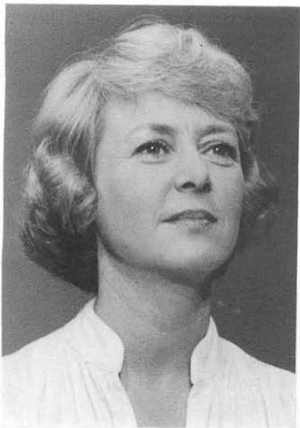
Mme Finnbogadottir, présidente de la République d'Islande

Ensemble nous avons rencontré des personnes actives dans la politique, les médias et la profession médicale ; des artistes, des universitaires et des responsables de l'église luthérienne (prédominante là-bas). Nous avons aussi eu la chance d'obtenir un entretien avec Mme Vigdis Finnbogadottir, présidente de la République islandaise. « Au lendemain de la dernière guerre, nous dit celle-ci, nous sommes subitement passés du stade du Moyen Age à celui de l'industrialisation. Ce fut beaucoup trop rapide. » Elle se préoccupe également de la jeunesse de son pays : « Comment l'aider à trouver son chemin tout en l'incitant à plonger ses racines dans notre culture ? » se demandait-elle. A propos des relations de l'Islande avec d'autres pays, Mme Finnbogadottir déclare : « Il faut, avant tout, que nous soyons conscients d'appartenir au groupe des pays nordiques. » Ses premiers déplacements, en tant que présidente, soulignèrent bien ce souci : après s'être rendue au