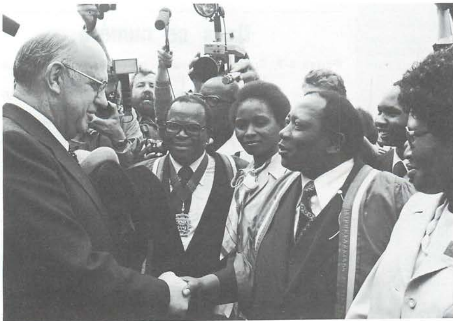
M. P.-W. Botha, premier ministre, lors de sa visite à Soweto en 1979.

Cette fois-ci – deux ans après mon précédent séjour – les signes de changement étaient manifestes. L'accession au pouvoir de l'actuel premier ministre, P.-W. Botha, avait suscité dans le pays une vague d'espoir : il avait réussi à convaincre la majorité des blancs et des noirs qu'un programme de réformes acceptables par tous n'exigerait de grands sacrifices de personne. Ce bel optimisme était sans doute illusoire. Il est clair aujourd'hui que tout train de réformes susceptible de convenir aux masses noires et à leurs dirigeants exigera de la part de la population blanche la perte de ses privilèges et toute une série de sacrifices coûteux. D'où la détermination d'une minorité de la population à combattre un tel programme par tous les moyens possibles. Inutile de préciser que les méthodes de cette opposition de droite ne sont pas particulièrement timorées, comme en ont fait l'expérience les habitants de l'Afrique du Sud-Ouest (la Namibie), dont le territoire commence à tenir lieu de terrain d'entraînement pour les militants de la résistance blanche.