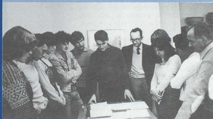
Les jeunes du stage de dix mois avec l'équipe de rédaction de la revue Changer .