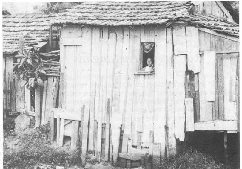
La favela, recours ultime des déshérités des villes ou des immigrants du nord-est.