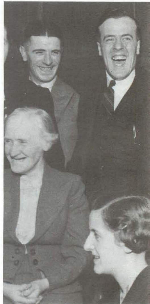
Frank Buchman entouré de quelques-uns de ses collaborateurs années trente, à l'époque du lancement du Réarmement

(1) Builder of a Global Force , Grosvenor Books.