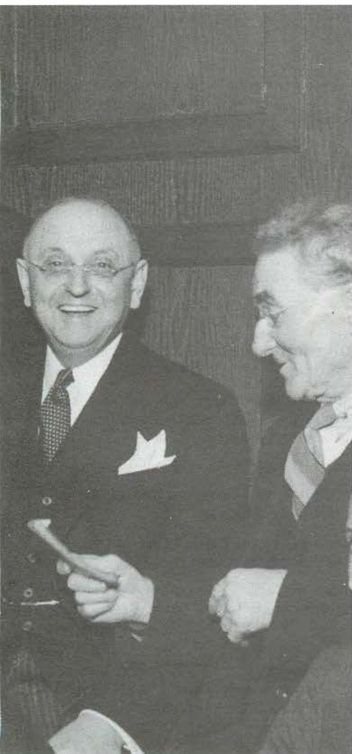
ateurs et de militants ouvriers de Londres à la fin des t moral.