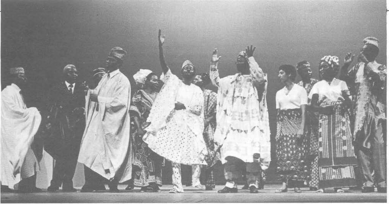
Une scène de l'Etape suivante.

« ordre moral » que de montrer l'exemple de l'intégrité. On peut espérer que dans le cas du Nigéria l'exemple sera donné d'en haut. Une indication dans ce sens nous est donnée par l'attitude adoptée par le président Shagari l'année dernière à la suite d'un incident avec le Cameroun à propos des eaux territoriales, incident qui fit cinq victimes sur un navire nigérian. Au lieu de suivre les objurgations de la presse nigériane, qui voulait « donner une leçon aux Camerounais », le président Shagari avait invité le président Ahidjo à Lagos et le conflit fut résolu très rapidement.