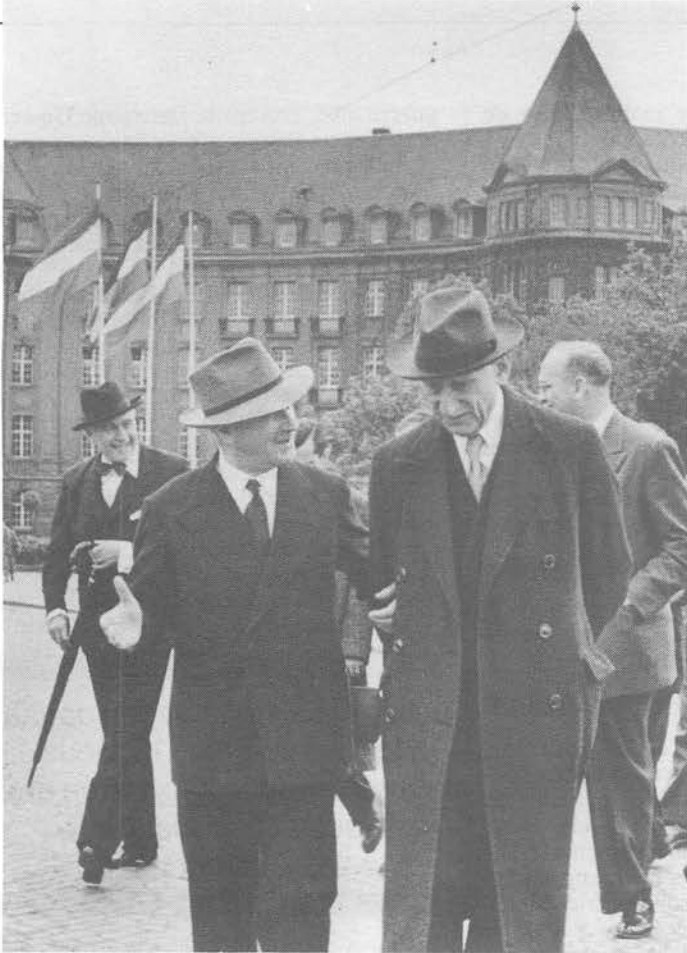
Au premier plan, Jean Monnet (à gauche) et Robert Schuman lors d'une réunion à Luxembourg durant les années cinquante.

paix parce que nous avons mal traité les Allemands. Nous les avons traités en peuple vaincu et, ce faisant, préparé une revanche. Si donc, après cette guerre que nous allons gagner, nous recommençons dans le même esprit, nous préparerons une nouvelle guerre. Il faut créer quelque chose où les Allemands soient inclus, et le faire tout de suite. Il y aura les Allemands, il y aura les Français, il y aura les Italiens, tous les Européens qui veulent se joindre à une communauté de partenaires égaux devant la loi commune. Les domaines concrets où il faut engager cette action sont ceux où la reconstruction des industries exigera des investissements tellement importants qu'aucune nation seule ne pourra les supporter.