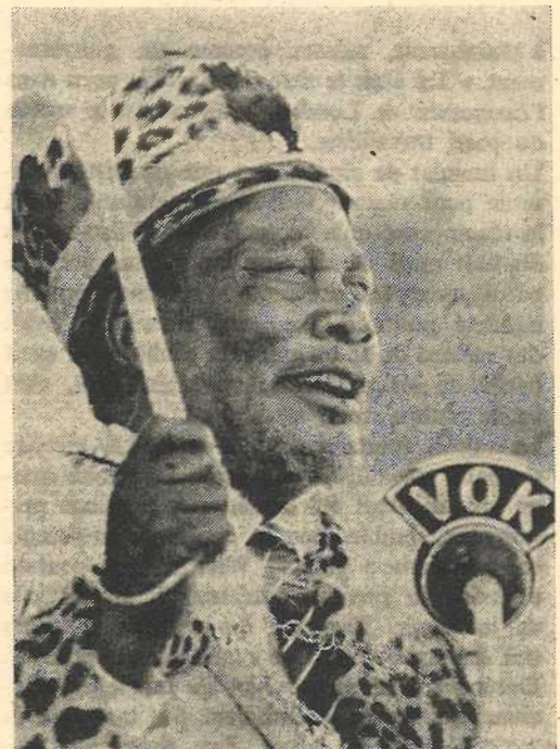
Le président Kenyatta