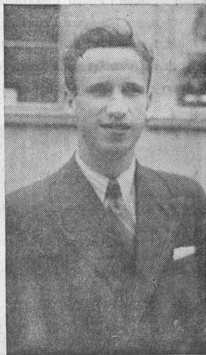
Studentvärlden behöver förvandlas, anser en representant för den studerande ungdomen.

Där var en lagerarbetare uppe och talade om, hur han egentligen varit — inte Guds barn utan socialismens — och hur han kämpat för dess idéer. Först då han blev en av Kristus förvandlad människa upplevde han innebörden i den vackra tesen: Frihet, jämlikhet, broderskap! Som kristen blev han tvungen acceptera sig själv. Förut hade han i sitt arbete accepterat en annans lön och funnit