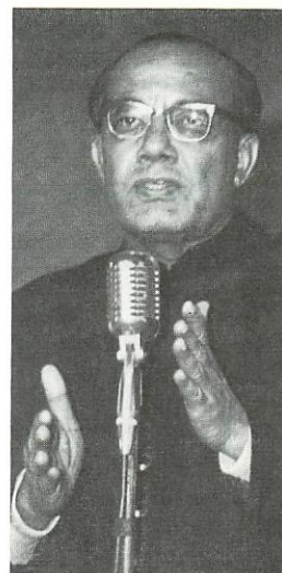
► Ministerpräsident Chaliha wendet sich nach einer Auf- führung von «India Arise» in der assamesischen Hauptstadt Shillong an das Publikum.