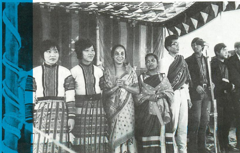
▲ Assamesen, Khasis und Mizos aus Nordostindien stellen sich der Konferenz von Panchgani vor.