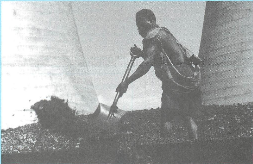
Arbeiter in einem sambischen Kraftwerk

Seit seinem Amtsantritt versucht er eine neue Sachlichkeit einzubringen. Laut ihm sind die Afrikaner, nicht bloss ihre früheren Kolonialherren, für die Probleme des Kontinents verantwortlich: «Sambia sollte sich selbst Vorwürfe machen. Überall in Afrika, wo die Verteilung der Güter gepredigt wurde, bevor diese erzeugt waren, müssen wir uns selbst die Schuld geben.» erklärte er auf einer Pressekonferenz. Er beschwört sein Volk, «Disziplin zu üben, hart zu arbeiten und mit Entschlossenheit den Problemen ins Auge zu sehen und sie anzupacken.» Er fühlt sich der freien Marktwirtschaft verpflichtet, obwohl er sich der dadurch bedingten, vorübergehenden