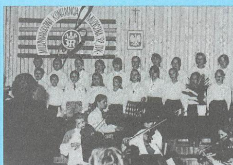
Der Chor der Musikschule von Jasło