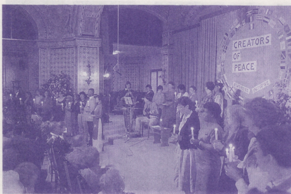
●62カ国から約680名が参加した「平和の創造者」会議

アジア・太平洋へと移りつつあります。この地域で起こっていることに、世界の益々目を向けています。日本の古い文化、長年培われてきた伝統、そして大いなる経済的潜在力によって、皆さんは過去を癒し、未来を創り出すことができます。皆さんが、この高邁なるビジョンをもってそれを成し遂げる上で、私どもも何か協力できることがあれば非常にありがたいと思っております。(終)