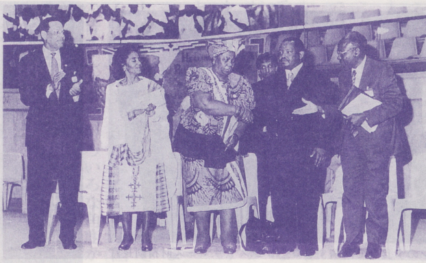
●南アフリカで開かれたMRA国際会議

アパルトヘイトの傷が癒えぬ南アフリカにおいて、MRA国際会議・テーマ「過去を癒し、未来を築く」(四月四日～八日)が開かれました。マンデラ政権誕生後の南アで初めてのMRA国際会議となったこの会議には、南ア国内はもとより、二十二のアフリカ諸国、