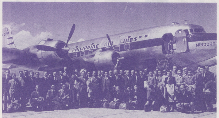
●アメリカのマキノ島やスイスのコーで開かれたMRA会議に出席した、広島・長崎の両市長、国会議員、経済人、労働組合代表等からなる代表团 [1950年]

会議場に着いた私は一所懸命、毎日のミーティングに参加しました。そうしたら、どのミーティングも、世界の政策とか国際関係の話なんかひとつもなならないんです。仲良くするには、自分たちの国がどこを反省して、相手のどこを理解したらいいのか、ということとを胸襟を開いて話しあうのがMRAのミーティングであり、そう