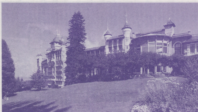
●MRA世界会議場、コー・マウンテン・ハウス