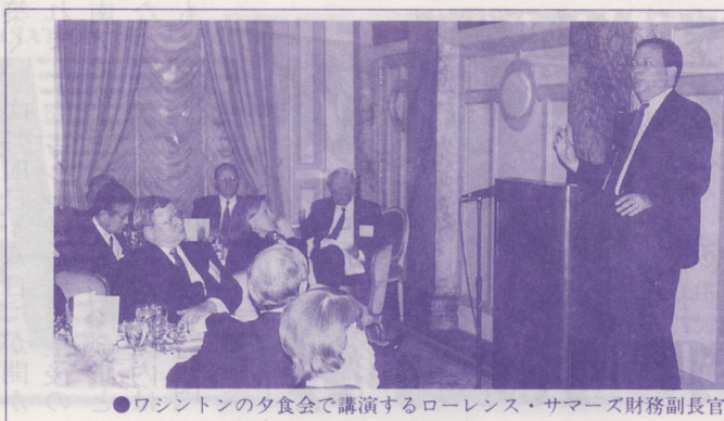
●ワシントンの夕食会で講演するローレンス・サマーズ財務副長官