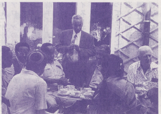
●和解の道を模索するソマリア各派の代表

たとえばソマリアの例がそうです。ソマリア人のグループが今年の夏、再びコーに集まります。ソマリアから来る人もいれば、亡命先の国から来る人もいます。彼らは分断した三つの部族の代表です。戦争によって引き裂かれた母国のために、統一と平和という基盤に立った話し合いが持たれるのは、これで三回目になります。 彼らが初めてコーに到着した時、或る大学教授は『我が国民は床に碎け散ったガラスのようにバラバラになった。私は絶望で体の力が抜けてしまった』と言いました。彼らは何時間も膝突き合わ