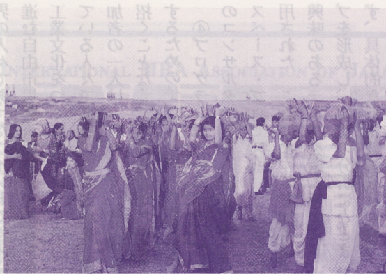
●開会式では地元の学校の生徒たちが歌や踊りを披露した