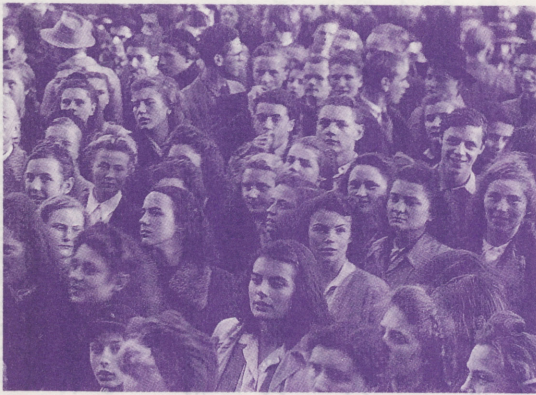
●戦後 5000 人のドイツ人とフランス人が共にコー世界大会に参加した

中の人々に提供し続け、アバルトヘイト下の南アの白人と黒人の代表の対話や、フォークランド紛争直後のイギリス人とアルゼンチン人の対話などを実現して来ました。近年も、対立関係にある旧ユーゴスラビアの人々や、カンボジア各派、あるいはソマリア各部落の代表などを迎え、問題解決の糸口を共に探りました。またベルリンの壁崩壊以来、次々と民主化を果たした東欧諸国からは、すでに数千人にのぼる人々がマウンテンハウスを訪れ、自由や民主主義の道義的・精神的基盤を模索しています。(終)