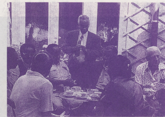
●和解の道を模索するソマリア各派の代表

中の人々に提供し続け、アバルトヘイト下の南アの白人と黒人の代表の対話や、フォークランド紛争直後のイギリス人とアルゼンチン人の対話などを実現して来ました。近年も、対立関係にある旧ユーゴスラビアの人々や、カンボジア各派、あるいはソマリア各部落の代表などを迎え、問題解決の糸口を共に探りました。またベルリンの壁崩壊以来、次々と民主化を果たした東欧諸国からは、すでに数千人にのぼる人々がマウンテンハウスを訪れ、自由や民主主義の道義的・精神的基盤を模索しています。(終)