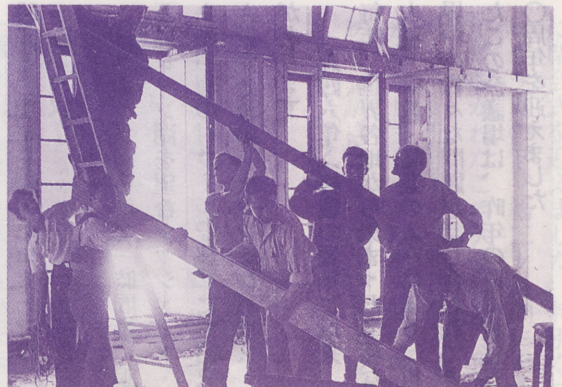
●人々の手作業で行われた修復作業

ある時モチューは、レマン湖畔の山腹に建つコー・パレスの事を思い出し、このホテルで夏の間会議を開