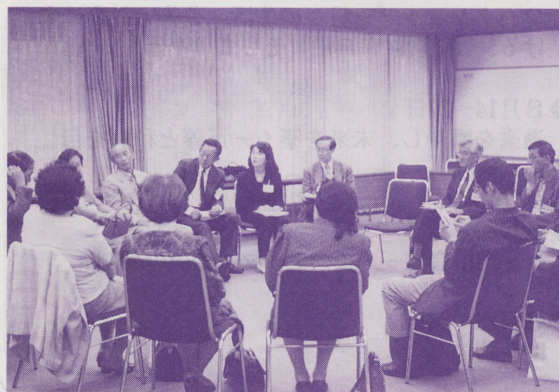
●熱心に話し合う参加者の皆さん