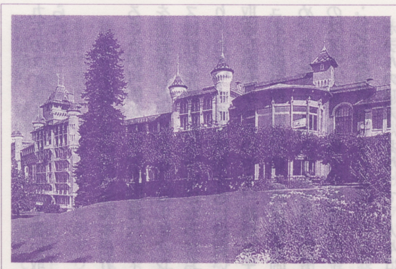
●MRA世界会議場コー・マウンテンハウス

設立五〇周年を迎えたコー・マウンテンハウス ジュネーブから車で一時間半、眼下にレマン湖を望むドゥッシェ・ド・ネ山中腹の村コー (Caux) に、MRA世界会議場「マウンテンハウス」があります。 一九四六年(終戦の翌年)以来、毎年、世界各地から集まった多様な人種・宗教・職業の人々により、世界中の様々な問題が話し合われてきたこの会議場は、昨年の夏に設立五〇周年を迎えました。