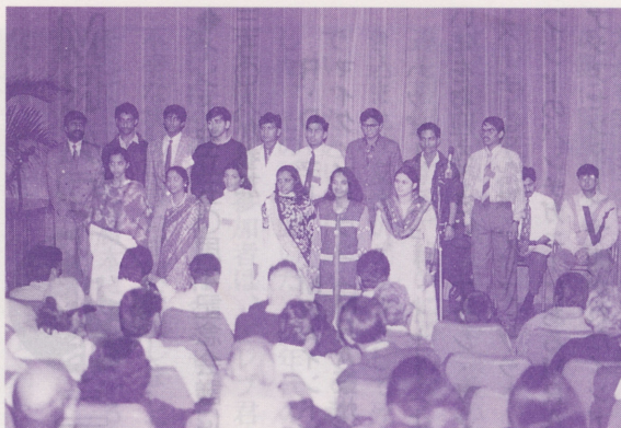
●大活躍したインドの若者たち

界の人々であった。インドで急速に進む自由市場経済に見合った新たな工業文化をつくりあげようと努力している人々である。この動きを、参加者の一人は「精神面での貧困化を招くことなく、経済的豊かさを実現するためのチャレンジ」と表現した。 ④プログラムの三分の一で、プロのコンサルタント率いるオープン・スペース・プロセスという方式が採用された。これによって参加者は、興味のあるテーマを選んで小グループを形成し、現状の分析にとどまらず、具体的な行動計画を話し合うことができた。テーマは多岐にわたり、