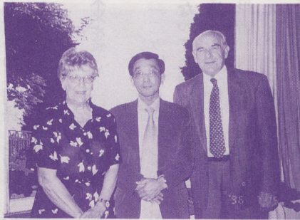
●マーセル・グランディー・コー財団理事長ご夫妻と記念撮影