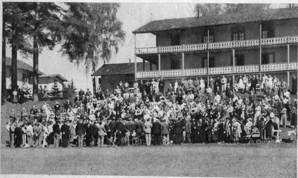
Grupp av mötesdeltagare på Modum Bad.

house party. Den objektive iakttagaren kan utan svårighet sätta sig ner och räkna vilka av dessa människor, som redan äro »förvandlade» bara genom att se på deras anleten. På den oinvidde verkar denna oförklarliga glädje irriterande. Ju intensivare han känner att dessa kristna äga något, som han själv är utanför, dess längre och dystrare bli hans anletsdrag. Men redan några timmar eller dagar senare har han själv fått ett nytt ansikte — såsom engelsmännen fullkomligt träffande uttrycker saken. Och han hör nu till mängden av överlyckliga, som ett tu tre brista ut i klingande oemotståndligt smittande skratt.