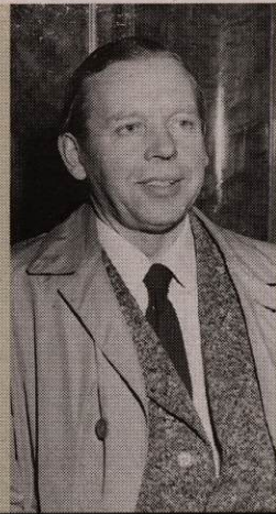
Erling Wikborg var den reelle lederen for Oxfordvekkelsen i Norge. Han ble omvendt på et av de første møtene. Wikborg ble senere leder for Kristelig Folkeparti og utenriksminister.