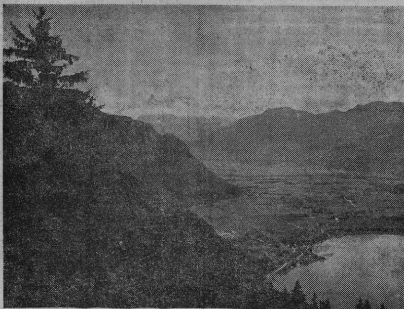
Fem hundre meter under Mountain House ligger Genfersjøen og Rhonedalen.

En overordentlig betydningsfull konferanse i et interessant og eien- dommelig miljø. — I neste artikkel skal jeg fortelle litt nærmere om mine egne opplevelser og observa- sjoner under et elleve dagers opp- hold i Caux.