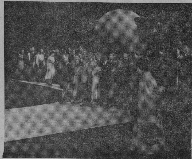
«De forvandlede vil gi verden det inspirerte demokratiske ideologi.» — Slutningsscenen i MRA's revy «Den gode vei».

Hvem skal bli Europas fremtidige herskere? Hvilken idé skal dominere verden? Øst for jernteppet formes i dag en ungdom som vet hva den vil. Se nærmere på disse deltakerne i den store kommunistiske ungdomskongressen i Budapest i sommer. — Øverst fra venstre en ung jøde, en tysker og en polsk pike. Nederst en albanergutt ved siden av et portrett som noen hver vil dra kjensel på. Skal Vesten finne et svar på denne utfordring?