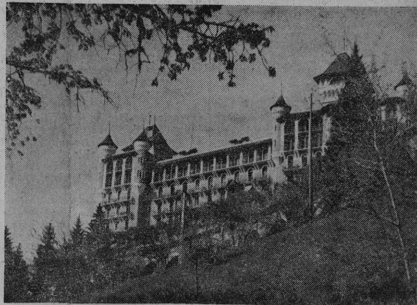
Mountain House — MRA's hovedkvarter i Caux.

en total krig må være en total seier. For å oppnå det må vi vinne ikke bare våpenkampen, men også idékampen. Når den totalitære materialisme, den organiserte «jeg-vil-ha-ånden», blir en kjempende livsform, streber den like målbevisst etter at andre lands åndelige territorium skal okkuperes og deres livsform endres, som de væpnede angrepsstyrkene gjør det. Det store spørsmålet for vår samtid er: Hvilken idé skal dominere verden når krigen er slutt? Demokratiet bestemmelse må bli å