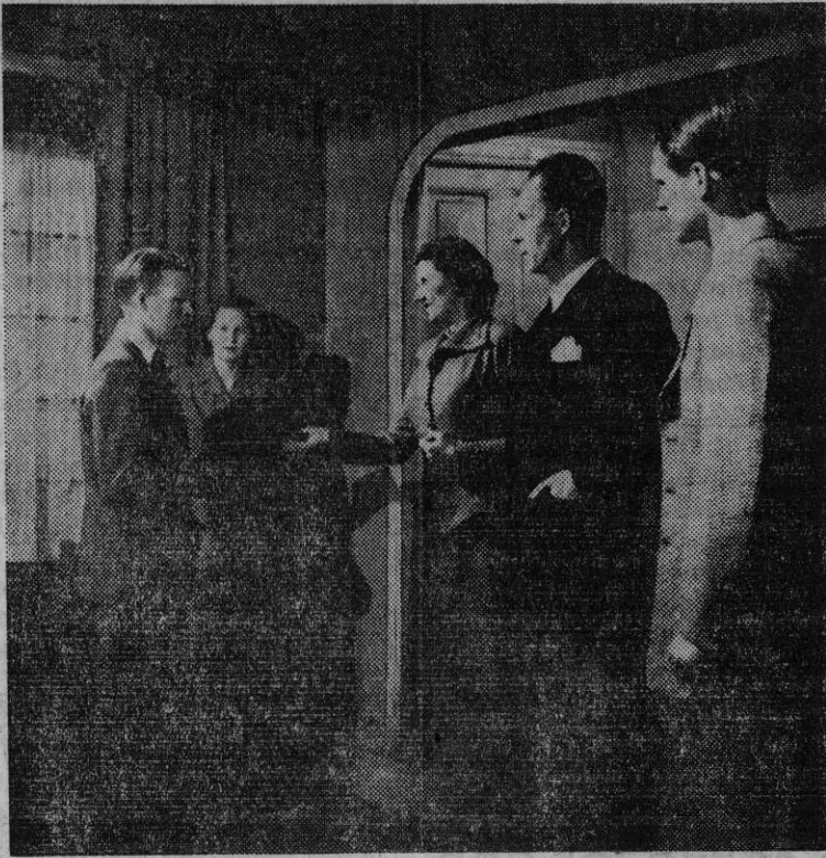
Vi ser her fagforeningslederen komme på besøk til direktøren. — Lengst til høyre sees sønnen som har gjort dette møtet mulig.

gen og den personlige kontakt med representanter for M. R. A. gjør at innvendingen om at «dette er bra, men det kan ikke gjennomføres» faller til jorden. En må, med eller mot sin vilje, innrømme at her gis det et svar på mange uløste spørsmål i dag: Det gjelder å begynne med seg sjøl, skape harmoni der, og så gå videre i hjemmet, på arbeidsplassen og i samfunns- livet. Kravene en stiller må en i første rekke stille til seg sjøl i absolutte etiske former.