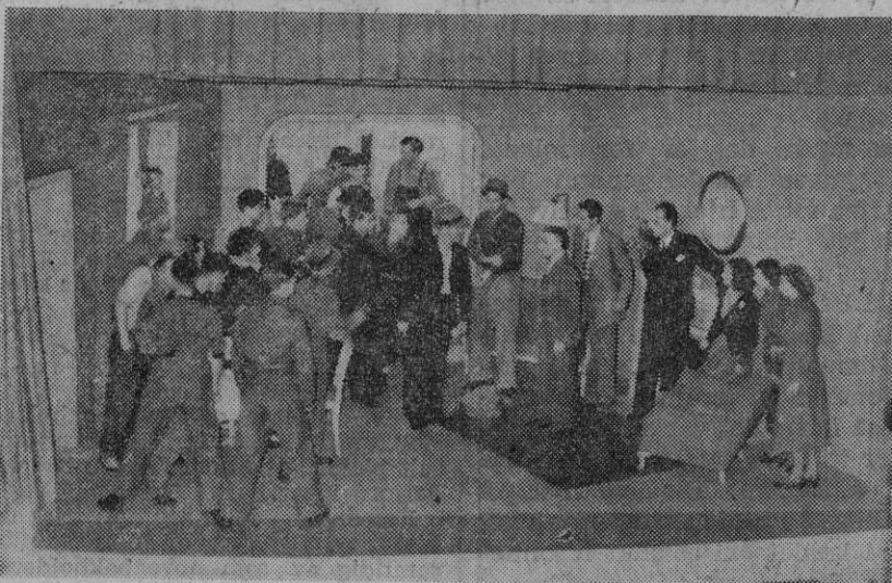
Frå den store scenen da oppgjøeren Joe Bush har stormet inn i direktør Wilsons hjem i spissen for en del representanter for arbeiderne. Vi ser fagforeningslederen Rankin i oppgjøret med Bush (med hatt og mørk dress). Nærmest Rankin står Dick Wilson. Så følger Wilson (foran speilet), fruene Rankin og Wilson og Betty Wilson.