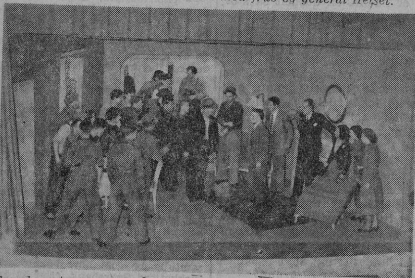
Fra den store scenen da oppgjøeren Joe Bush har stormet inn i direktør Wilsons hjem i spissen for en del representanter for arbeiderne. Vi ser fagforeningslederen Rankin i oppgjøret med Bush (med hatt og mørk dress). Nærmest Rankin står Dick Wilson. Så følger Wilson (foran speilet), fruene Rankin og Wilson og Betty Wilson.