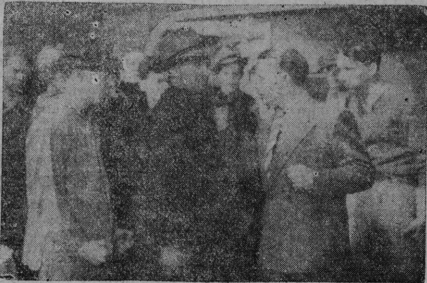
Scene fra «Den glemte faktor — oppløpet.