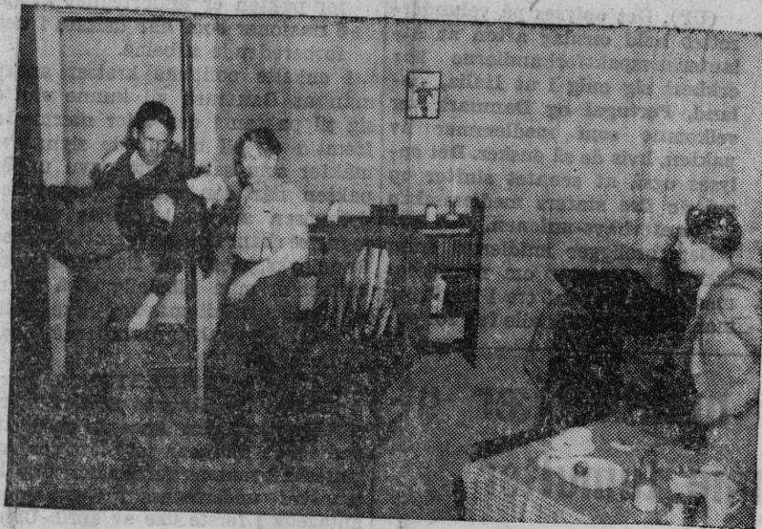
Den dramatiske scene, da fagforeningsformannens datter blir båret inn i hjemmet etter å være slått ned under et oppløp i fabrikk.