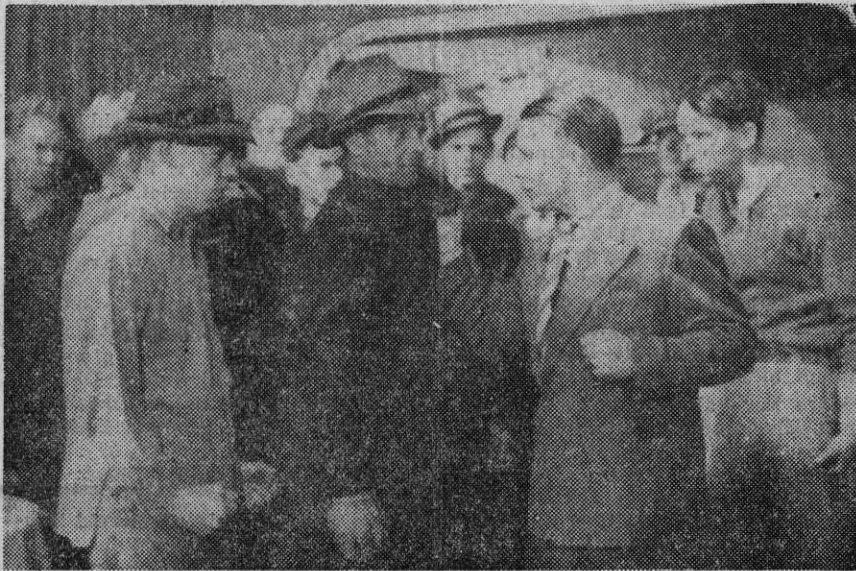
En scene fra opptrinnet i direktørens hjem. Fagforeningslederen har grepet provokatøren «i snippen».

Opprustning er ikke noe ukjent ord i vår generasjon hvor krigsfly og atombomber er blitt framtrepende trekk i tidsbildet. Men i disse dager er en ny kombinasjon av ordet rykket oss nærmere inn på livet — Moralsk Opprustning. Og skal det i denne vår jordiske jammerdal først være snakk om opprustning så kan det på den moralske fronten i og for seg være både betryggende og tiltalende.