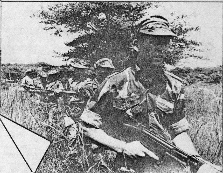
"Inbördeskriget "utan hopp" kallades den brinnande konflikten i Rhodesia. Inte ens rödakorsarbetare respekterades.

svar." Och efter en sista krumelur i manuskriptet reste jag mig och gick. För att aldrig återvända som det visade sig senare.