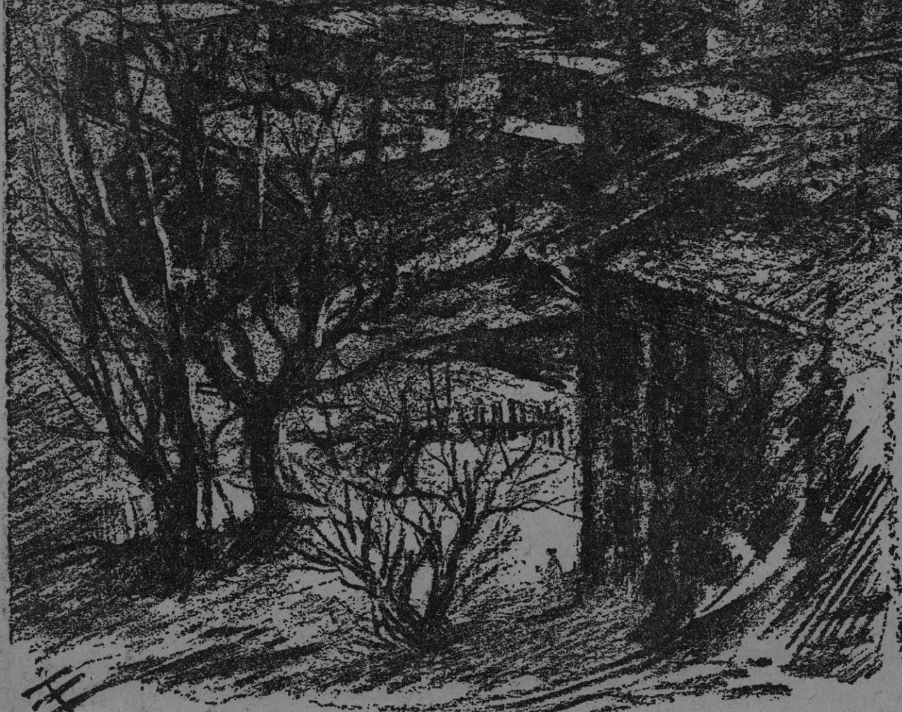
For Tidens Tegn av Olav Engebrigtsen

Oxfordbevegelsens mål er å komme i personlig kontakt med de enkelte mennesker for å lede dem til kristen livsforvandling. Det er den mest personlige opplevelse som overhodet finnes Oxfordbevegelsen vil frembringe i de enkeltes liv.