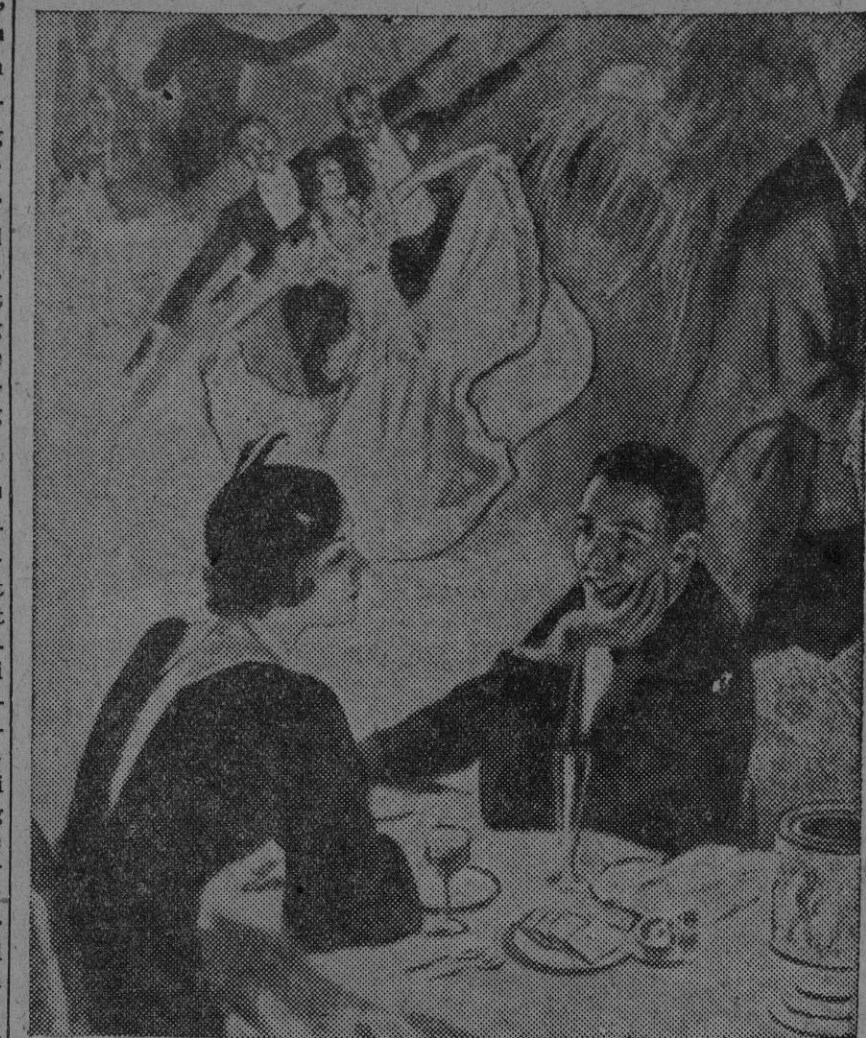
To ensomme, som ikke føler ensomheten.

For så og, så lenge siden var det hvite timer da ikke engang en fransk oppe på Montmartre, en pariser gjenkatt blunder. nemvket sin jule- og nyttårsmat. Disse Det var en selvfølge: dette lettive-