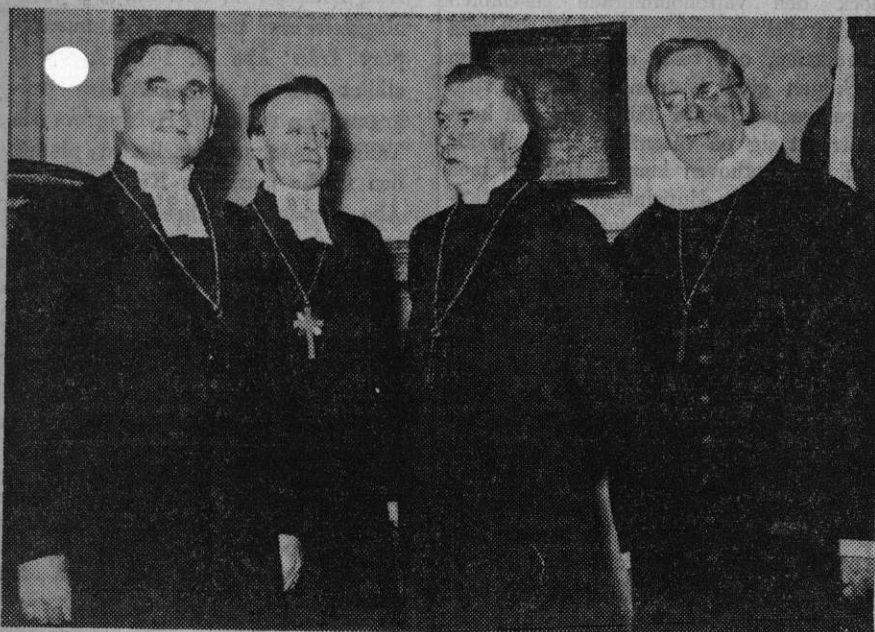
Från vänster: biskop Lehtonen, Finland, ärkebiskop Eidem, biskop Berggrav, Norge, och biskop Fuglsang-Damgaard, Danmark.

Stämningsfull och gripande gudstjänst i Storkyrkan med tal av Nordens kyrkochefer