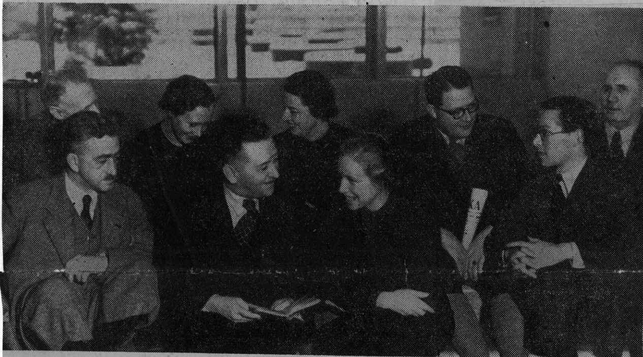
Några av deltagarna i Oxfordrörelsens house-party på Karlberg.

Det vore naturligtvis här på sin plats att ge en klarläggning av vad Oxfordgrupprörelsen är och vill, men det får anstå till en annan gång. Som en kort karaktäristik får räcka, att rörelsen är en form av aktiv kristendom, som anser att vägen till en ny värld blott kan gå genom människor, vilka gjort upp med sitt personliga livsproblem och lärt sig att ta ansvar. Dess moraliska codex är välbekant: Absolut ärlighet, absolut renhet, absolut osjälviskhet och absolut kär-