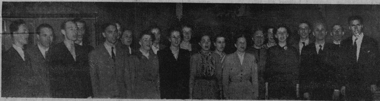
Det internasjonale sangkoret fotografert på Victoria Hotell.