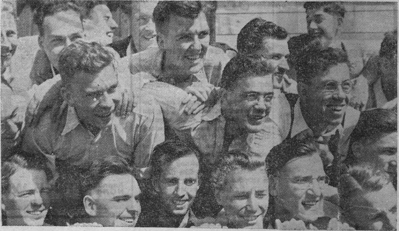
En del av deltagerne i Oxfordmøtet på Røros.