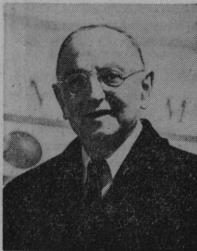
Dr. Frank Buchman

levd: selvisk komfortabelt og uforsstyrret.