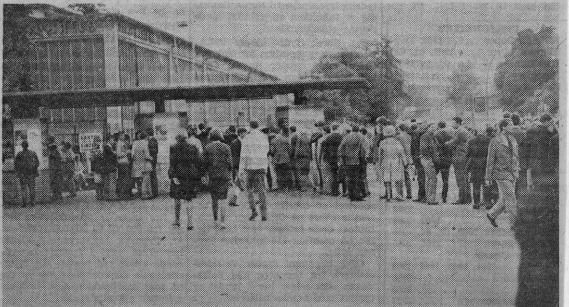
Ungdom i kø utenfor Ernst Merck-hallen i Hamburg.

Forsto vi skandinavene som var tilstede på forestillingen i Hamburg rett, ville de alle som én ønske «Sing Out» hjertelig velkommen til sine land, hvis det ble aktuelt. Det gjelder også Norge.