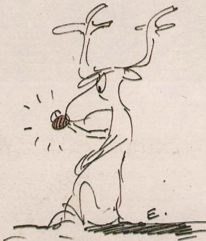
Rudolf satt og holdt seg på nesen...

Gamlenissen orker ikke tenke mer. Hans små, grå hjerneceller har for lengst satt fra seg joggeskoene og tatt på seg tøfler. Ting går langsommere i en verden der alt nå går fortere.